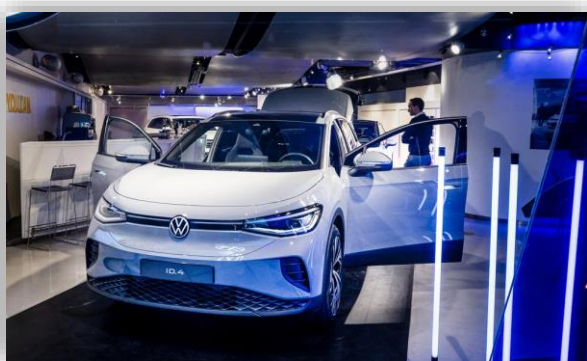
Bildextra: Volkswagen ID.4 har kommit till Sverige