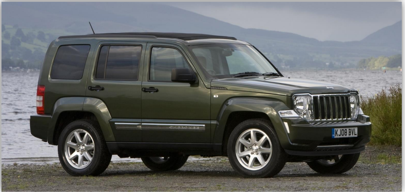
Cherokee (KK) 2007.