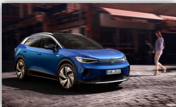
Volkswagen ID.4 kommer i sju versioner