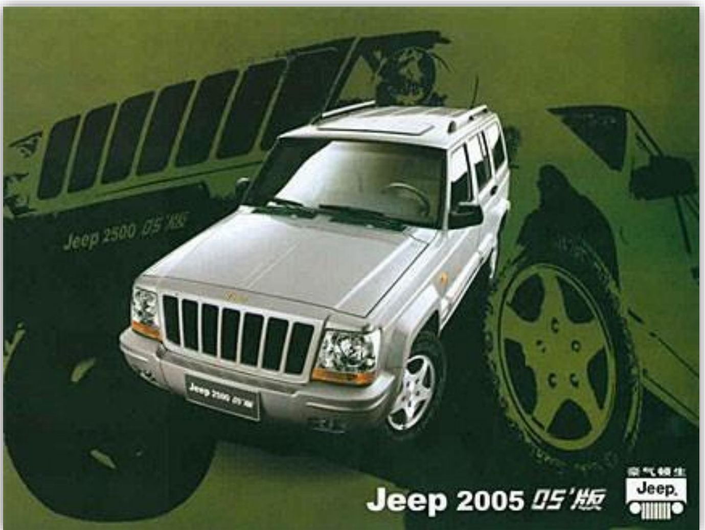
Cherokee XJ tillverkades även i Kina.

Den kinesiska Cherokeeen fick mot slutet en facelift som ser ut att behöva en tandreglering.