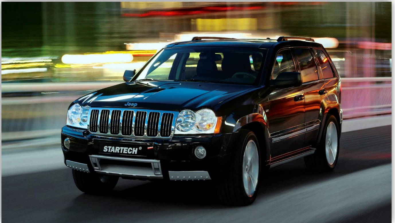
Grand Cherokee (WK) 2005–10.