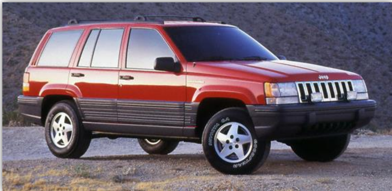
Grand Cherokee Laredo (ZJ) 1993–96.

En ny generation av Grand Cherokee kom 1998, WJ-generationen skulle sedan tillverkas till 2004. Grand Cherokee WK kom 2005 och tillverkas fortfarande.