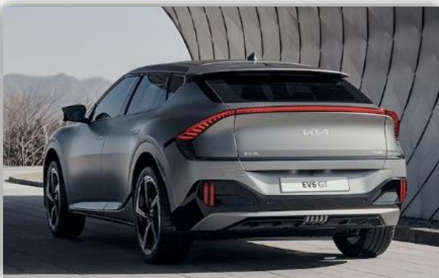
Officiell: Här är Kia EV6 – med svenska priser