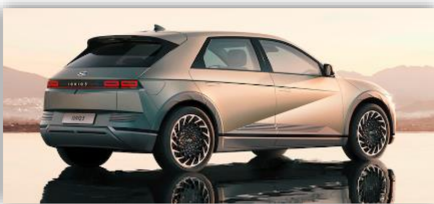
Officiell: Här är nya Hyundai Ioniq 5 – slår VW ID.4 på de flesta punkter