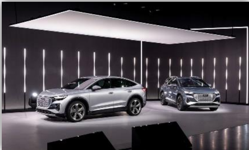
Audi Q4 e-tron och Q4 Sportback e-tron officiella