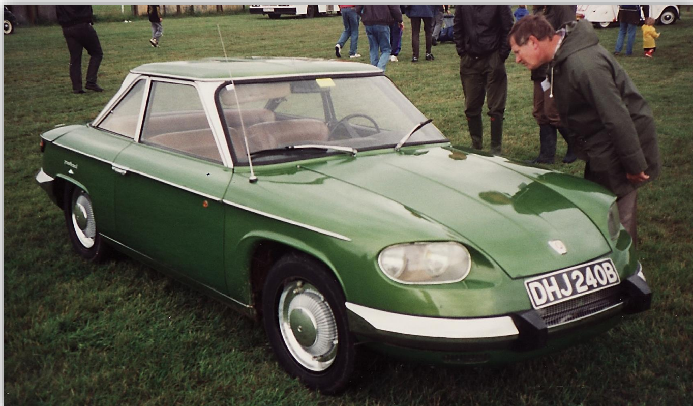
Panhard 24CT 1964.