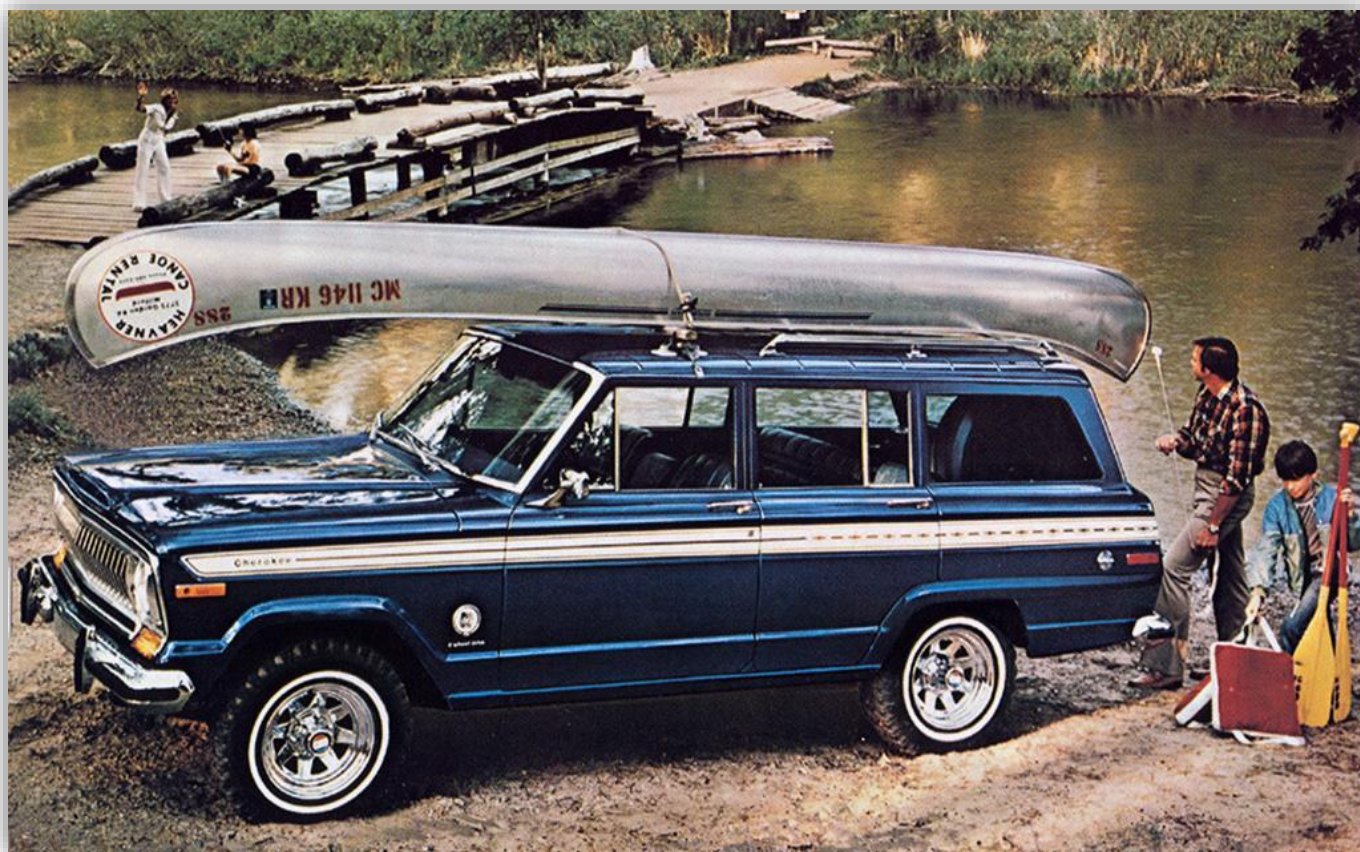
Cherokee 5-door (SJ) 1978–83.

Nu blir det riktigt komplicerat att förklara namnen, men när Cherokee XJ kom döptes Wagoneer om till Grand Wagoneer. Under det namnet fortsatt den att tillverkas till 1991. Samtidigt fanns det en lyxig version av Cherokee XJ med träimitation på sidorna som kallades Wagoneer.