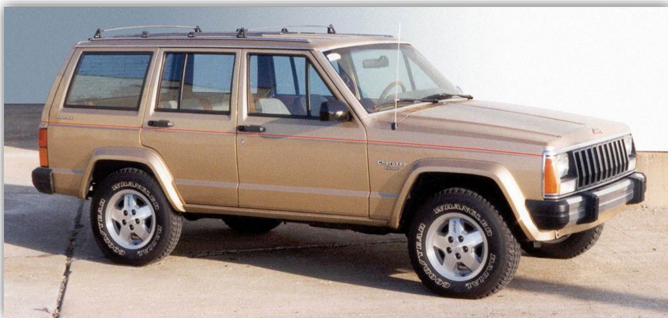
När den nya Cherokee XJ kom 1984 fanns den både med två och fyra dörrar.

1993 lanserades Grand Cherokee som var större till måtten och hade en V8. Om tanken var att den skulle ersätta XJ så gick det inte vägen. Den nio år gamla modellen fortsatte sälja i sådan omfattning att den inte gick att lägga ner.