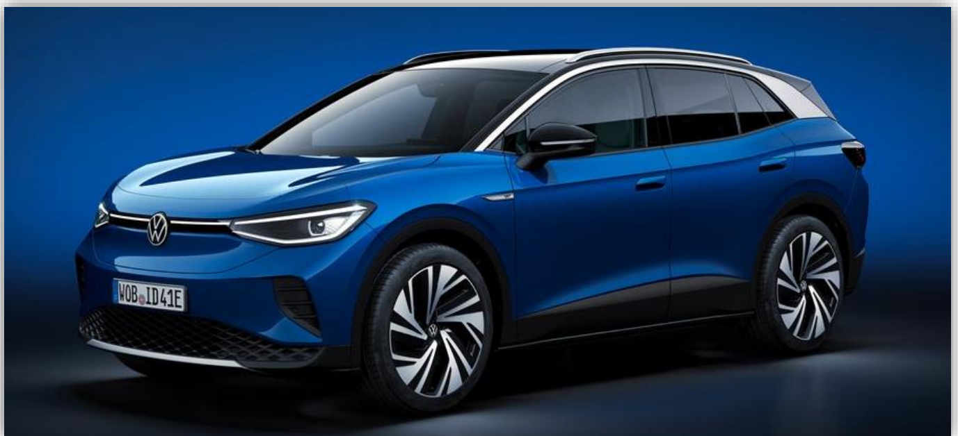
Volkswagen ID.4 i tvåhjuldriven version.

Volkswagen ID.4 GTX kommer också ha en del sportiga designdetaljer och ett annorlunda artificiellt motorljud än de svagare tvåhjuldrivna versionerna.