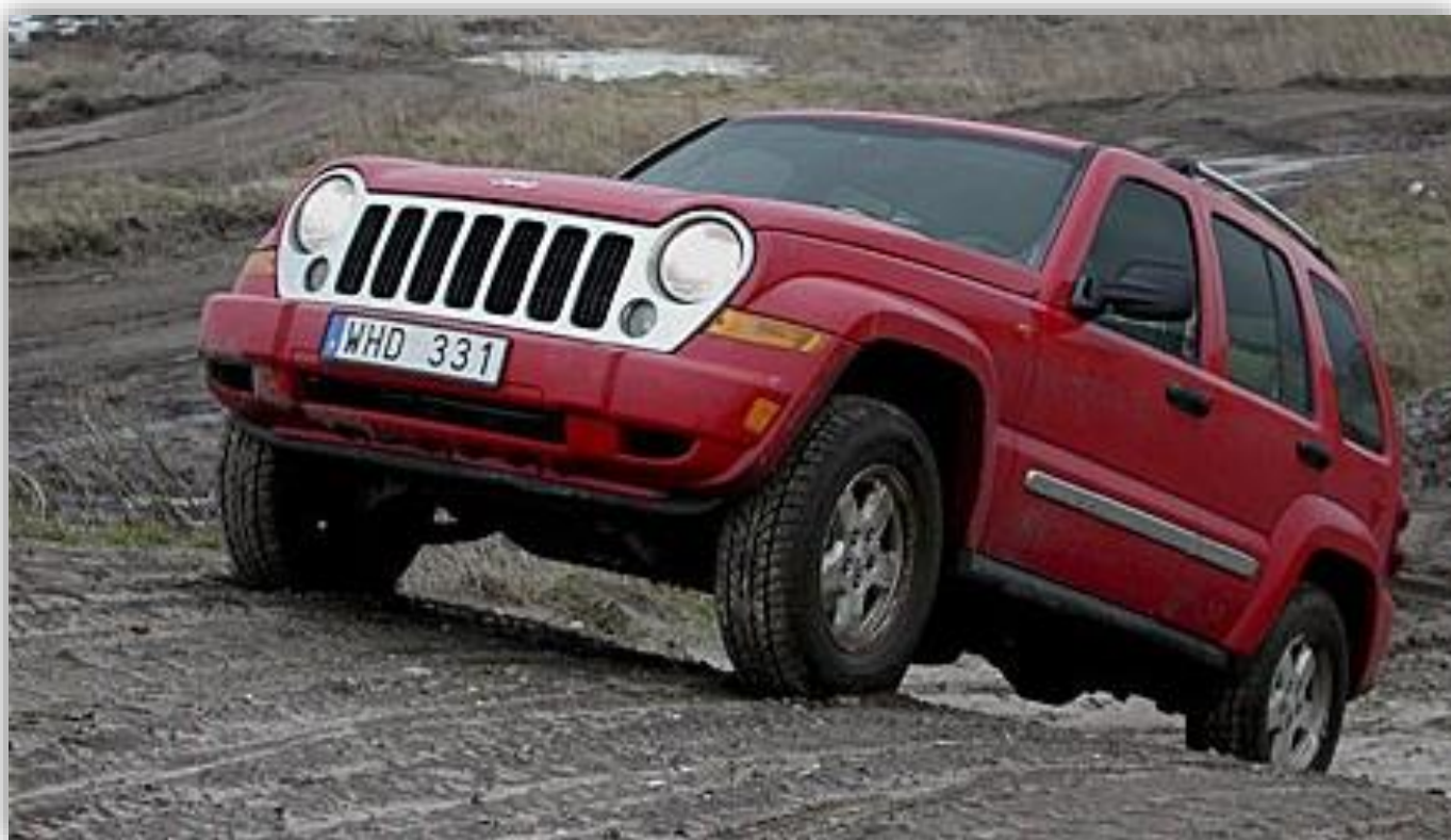
Efter 17 år var det dags för en ny Cherokee-modell år 2001.

2008 kom nya Cherokee KK . den senaste generationen Cherokee påminner utseendemässigt om Cherokee XJ med kraftigt markerade hjulhus och kantiga former.