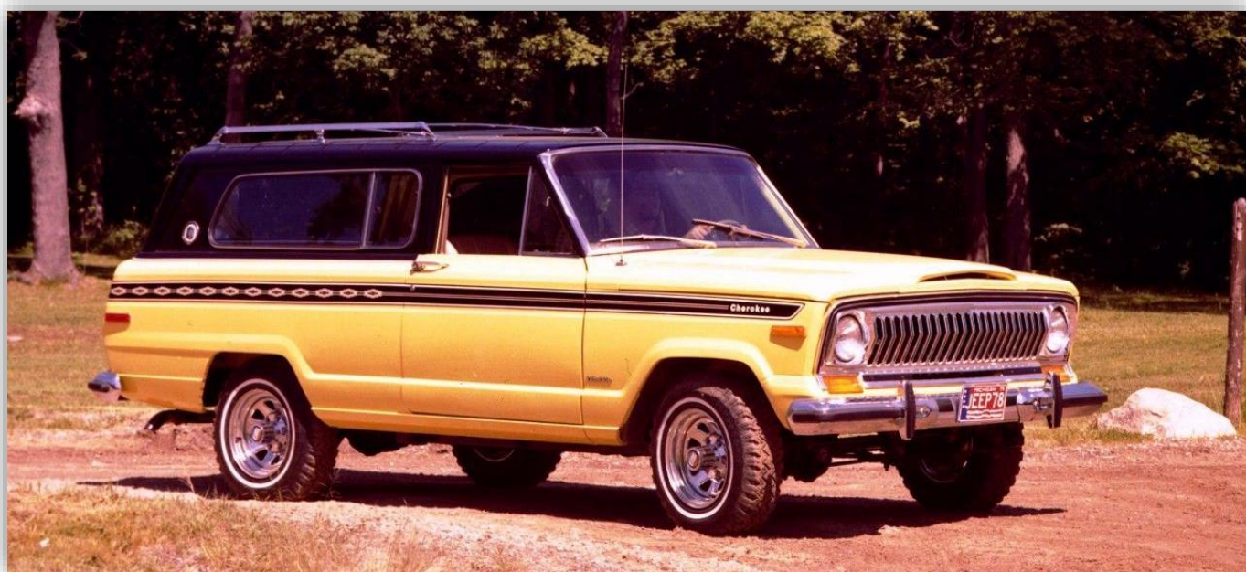
Jeep Cherokee (SJ) 1974–78.

Varje dag firar vi en ny bilnamnsdag från Klassikerkalendern. I dag när Georg och Göran har namnsdag vill vi gärna göra dig uppmärksam på Cherokee.