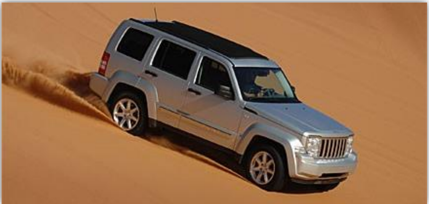
2008 kom den senaste generationen Cherokee. Designmässigt flörtar den med den åttiotalskantiga Cherokee XJ.