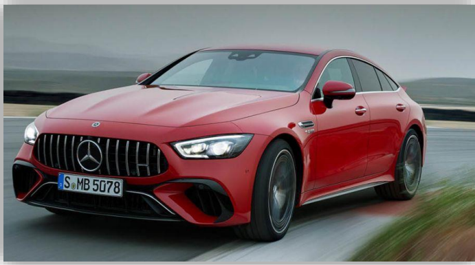
Mercedes nya "superhybrid" med massivt vridmoment.