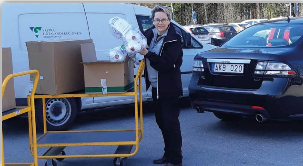
Nevs permitterar – och börjar bygga skyddsvisir.