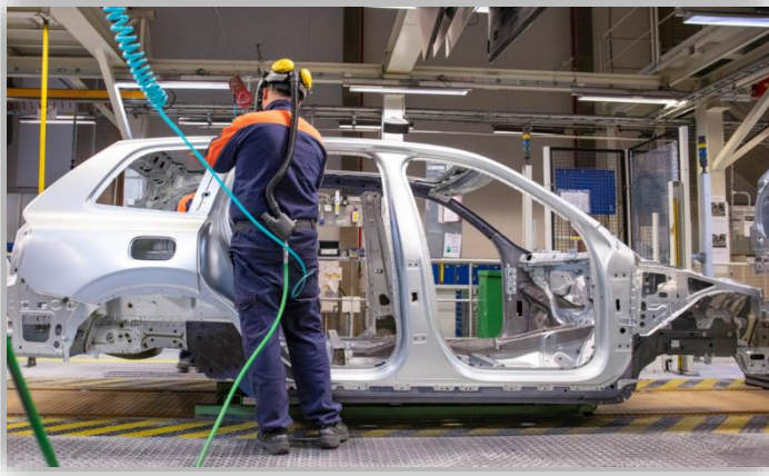
Nya hotet mot bilindustrin: Magnesiumbrist.