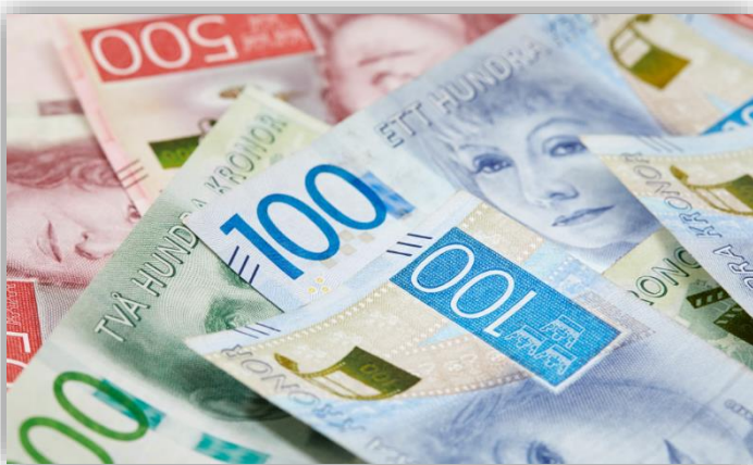
Höjd skatt för fler bensin- och dieslbilar att vänta 2022 – Regeringen vill fylla på klimatbonus-kassan.