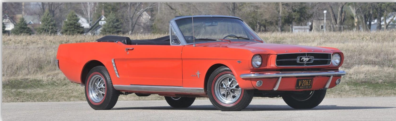
1964 Mustang convertible.