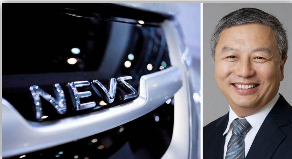
Nevs grundare lämnar: "Mitt skuldberg blir bara större".