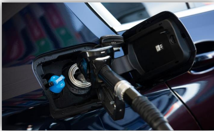
Så mycket har kostnaden för bränsle ökat beroende på vad du kör och var du bor.