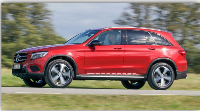
Limmet fäster för dåligt – takpanel kan lossna.