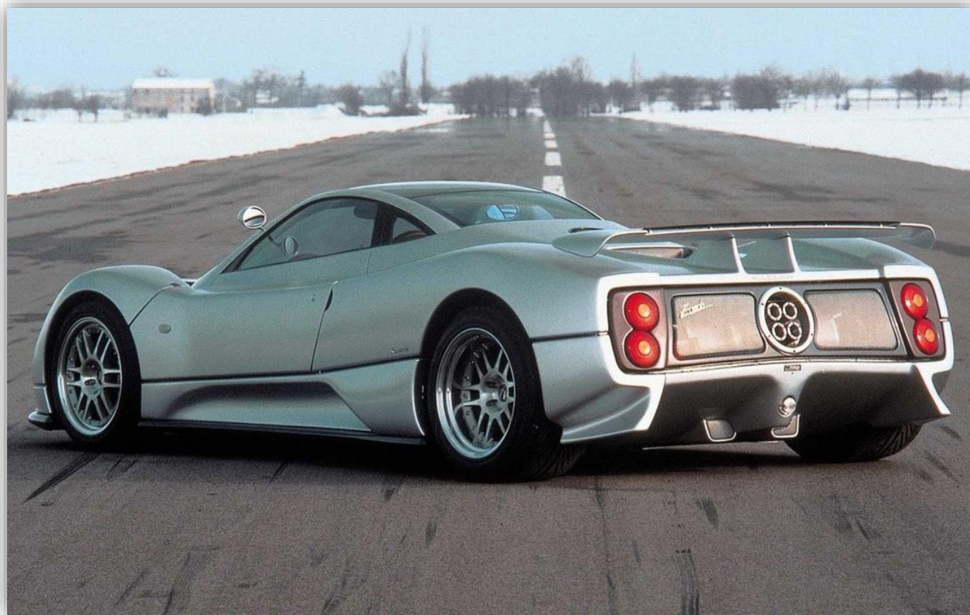
Zonda C12 från 1999.

Paganis grundare och vd - Horacio Pagani, berättar den här veckan att företagets nästa bil kommer att utrustas med en dubbelturbomatad V12:a på 6,0 liter från AMG och att den kommer att erbjudas med manuell växellåda. Om det handlar om en sekventiell låda eller en traditionell H-låda återstår att se. Enligt Horacio är detta ett drag eftersom det var kunder som inte köpte Huayra just av anledningen att man inte kunde få den med manuell låda. Denna nya modell ska vara för dem. Man kommer inte att satsa på överdrivet mycket hästkrafter utan istället på att få ned vikten. Någon elektrifiering är det inte tal på än, och man kommer att fortsätta på det viset så länge man kan.