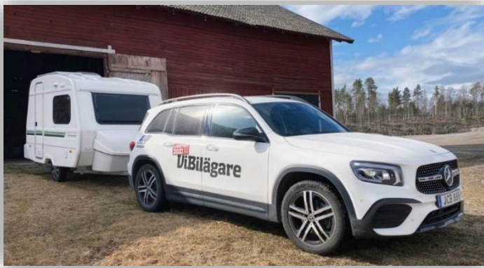
Mystiska felet felet: Toppfart på bara 75 km/tim.