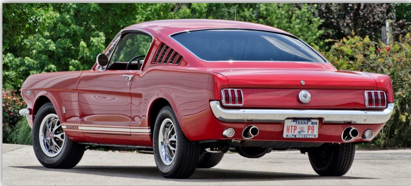
1966 Mustang Fastback

I Sverige var amerikanska bilar förhållandevis dyra på 1960-talet, en Mustang med V8 kostade runt 25 000 kronor ny när den lanserades (aningen mer än en Volvo P1800). Det betyder att få svensksålda bilar från 1960-talet fortfarande är i livet och finns att köpa på marknaden, men att det samtidigt är ett mindre problem eftersom det finns gott om USA-importer – vi svenskar har varit flitiga USA-bilsimportörer genom åren. Det stora utbudet här (och faktiskt nästan överallt) gör att man snabbt kan hitta en Mustang i det stuk man vill ha, även om man vill hålla sig till den första generationen innan den fick ett facelift 1967. Originalbil, renoverad eller patinerad, hottad för gata eller dragstrip, Shelbyklon eller blandningar av alltihop.