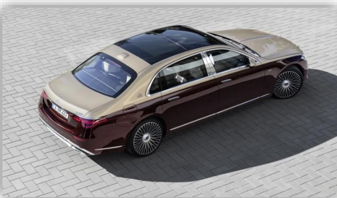
Så dyr är "snikversionen" av Mercedes lyxigaste bil.