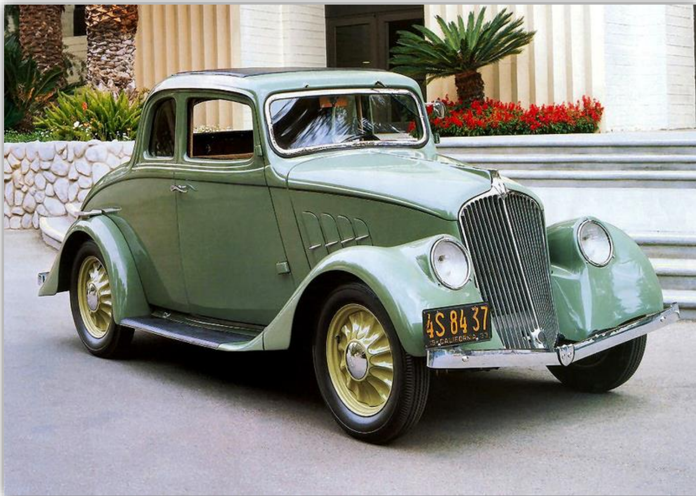
Willys Model 77 Coupe 1933–34.