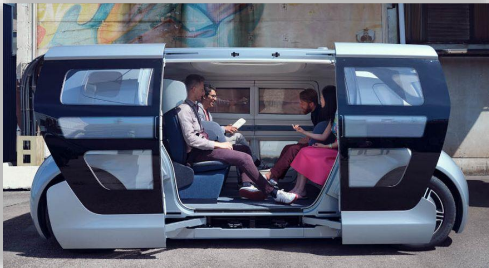
Här är Nevs bildelningstjänst – med ny självkörande bil.