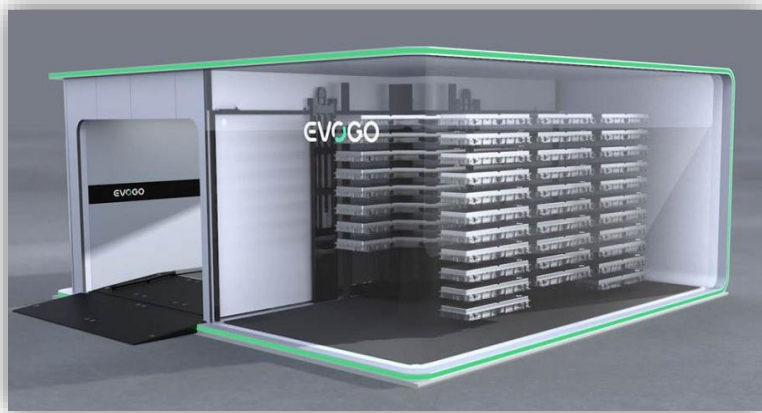
Ny tjänst för batteribyte på gång – "fulladdat" på en minut.