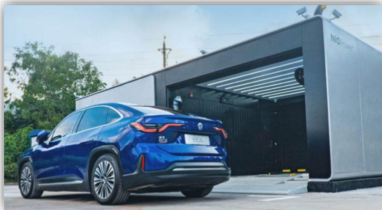
Uppstickaren gör 460 batteribyten – varje timme.