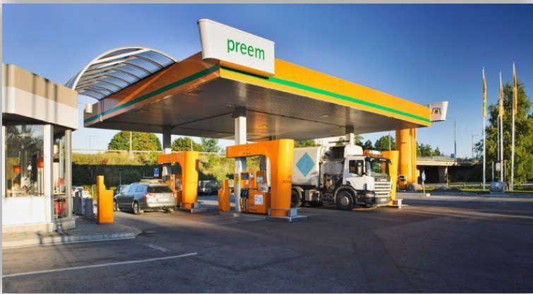
OKQ8 får konkurrens – Preem satsar på laddning.