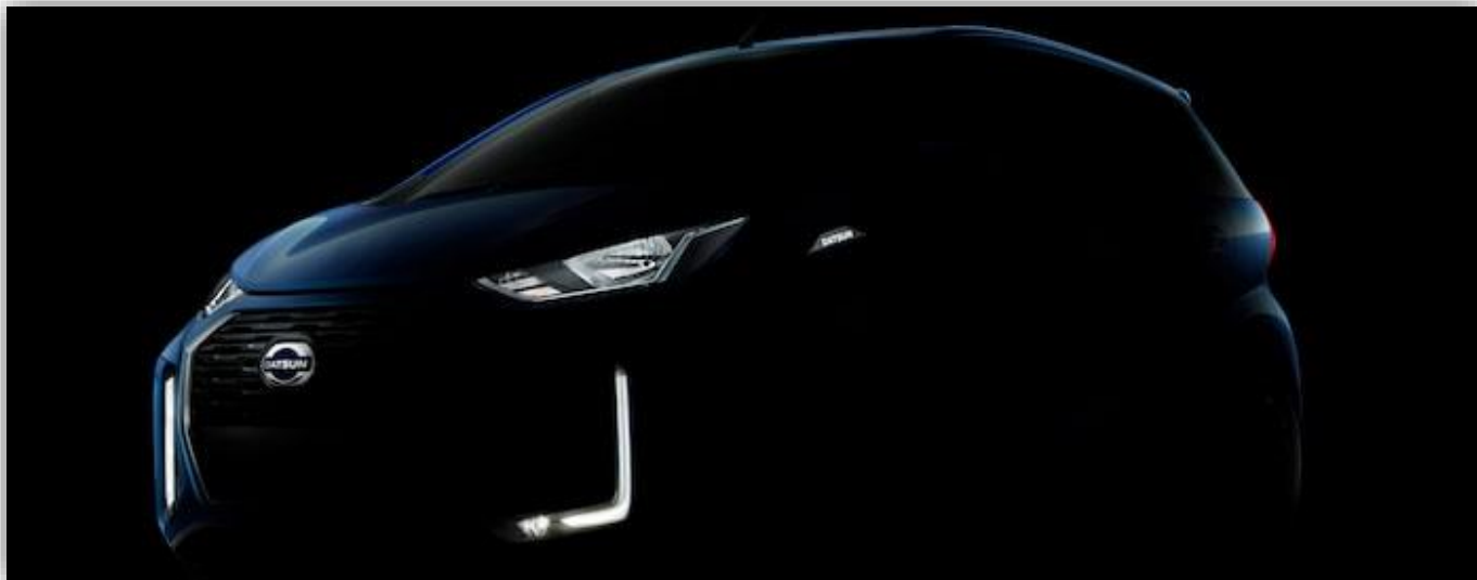
Nya Datsun Redi-Go hann aldrig sättas i produktion.