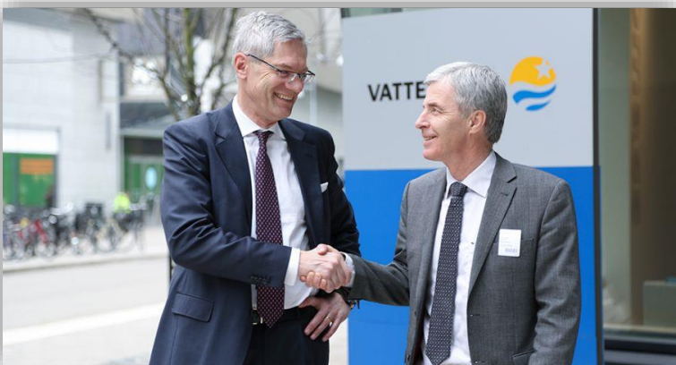
Preem och Vattenfall i vätgassamarbete.