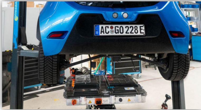
Ännu ett elbilmärke börjar med batteribyte.