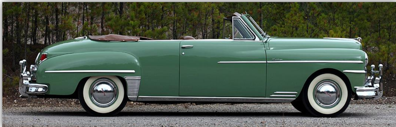
DeSoto Custom Convertible Coupe 1949.