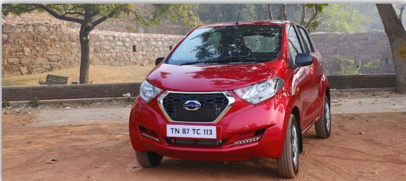
Redi-Go blev Datsuns sista modell i produktion.