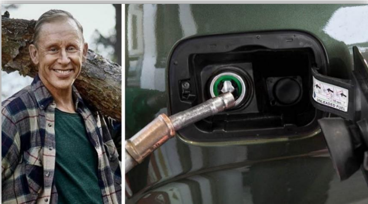
Nu krävs Preem på svar om bensinreklamen.