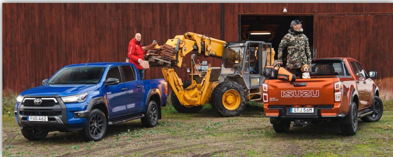
Toyota Hilux och Isuzu D-max.