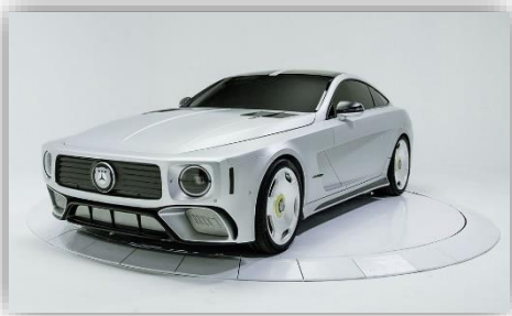
WILL.I.AMG – ett galet bygge från Mercedes-AMG.