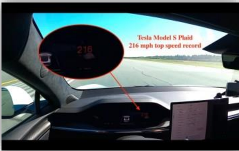
Nytt rekord? Hackad Tesla Model S Plaid kom upp i 348 km/h.