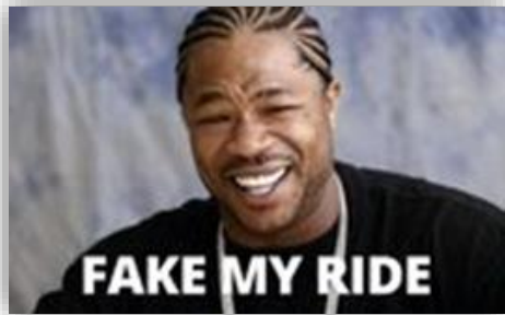
Avslöjat: Så fejkat var tv-programmet Pimp my Ride.