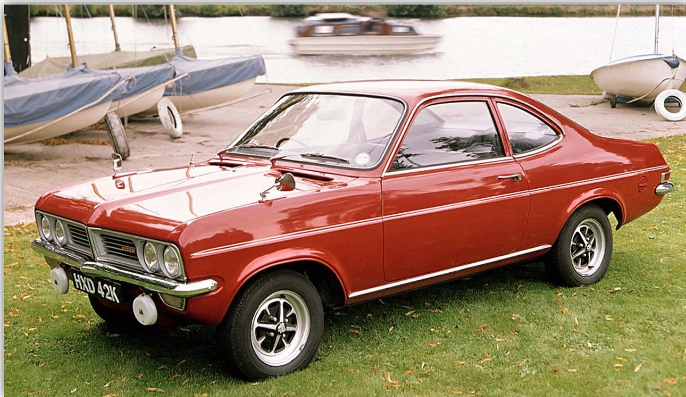
Vauxhall Firenza 1970–75.