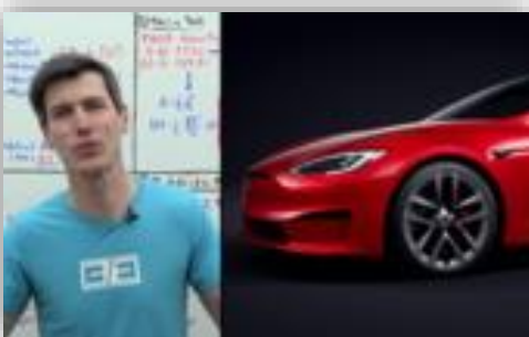
Nej! Tesla Model S Plaid+ klarar inte 0–60 mph under 2 sekunder.