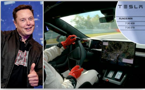
Video: Se Tesla Model S Plaid slå rekord runt Nürburgring.