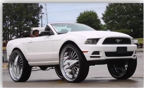
Ford Mustang på 32-tumsfälgar – fräckt eller bara dumt?