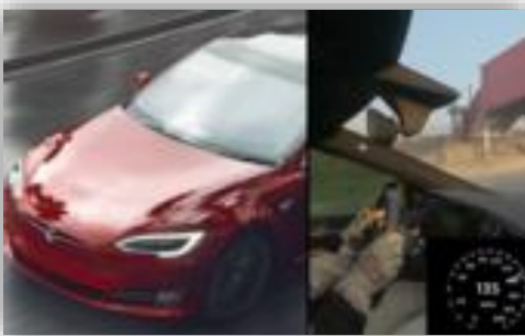
Tesla Model S Plaid på Laguna Seca – snabbare än McLaren P1.