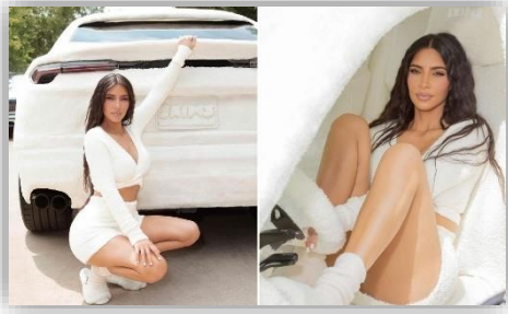
Kim Kardashians nya Lamm-bo – en Urus i fårkläder.