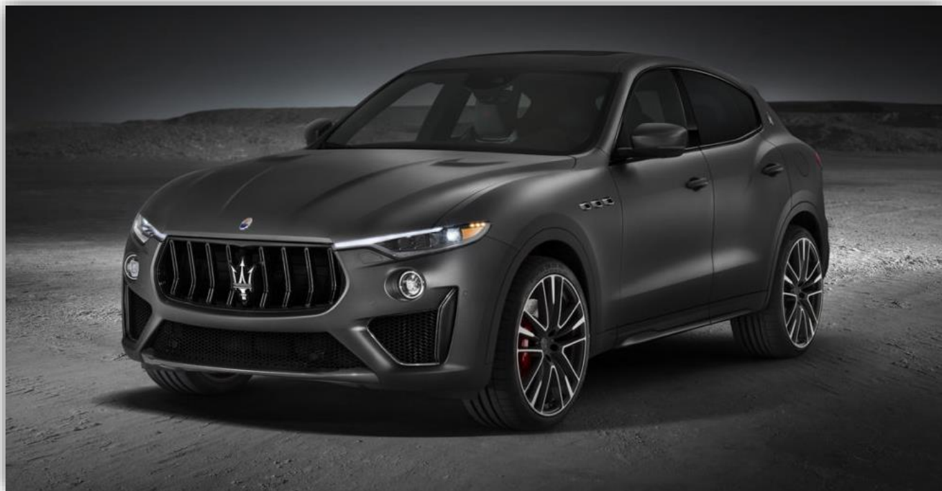
Maserati Levante Trofeo.

Maserati Levante Trofeo 2022. En riktig super-SUV som är Per Gessles bruksbil. Maseratin har 581 hästkrafter och toppar över 300 km/h.