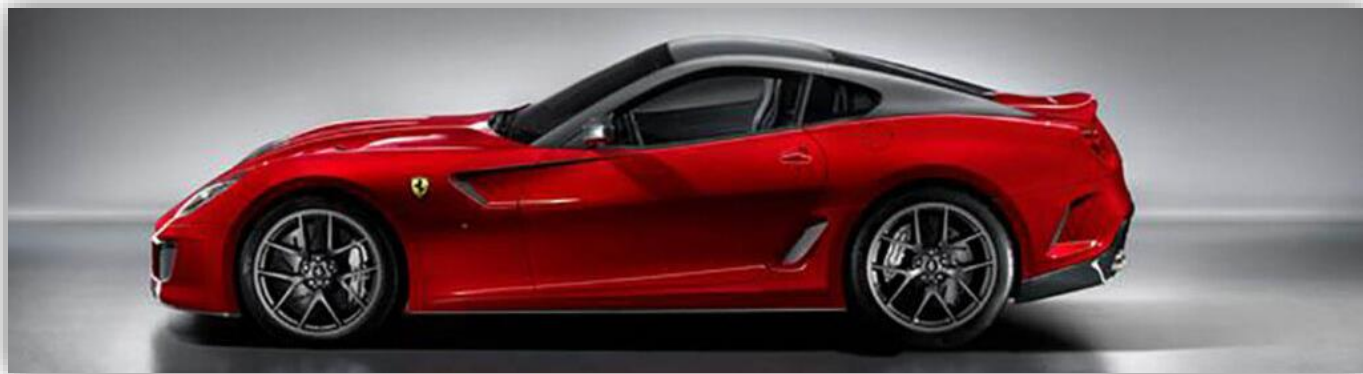
Ferrari 599 GTO.

Ferrari 599 GTO 2011. En extra dyrbar och supersnabb specialmodell av 599-modellen, V12-motor på 670 hästkrafter. Bilen är så värdefull att den aldrig ställts på och tagits ut i trafik sedan den var ny. Värdet närmar sig 10 miljoner kronor.