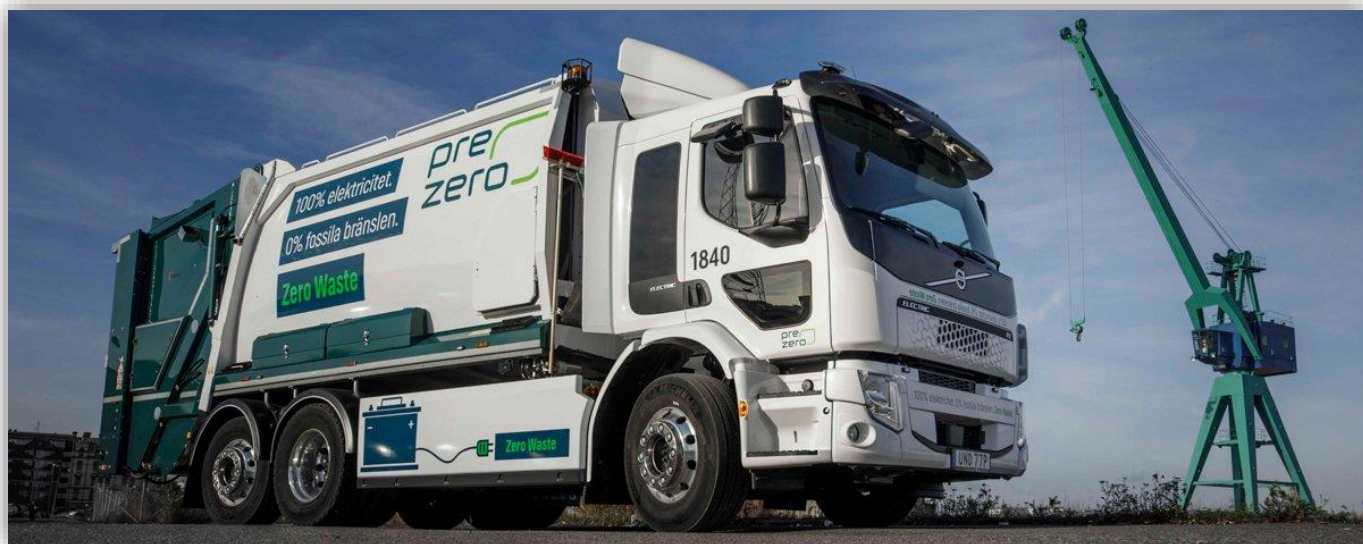
Volvo FE Electric saknar buller och har en räckvidd på upp till 20 mil.