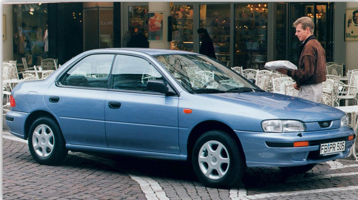
Subaru Impreza 1992–96.