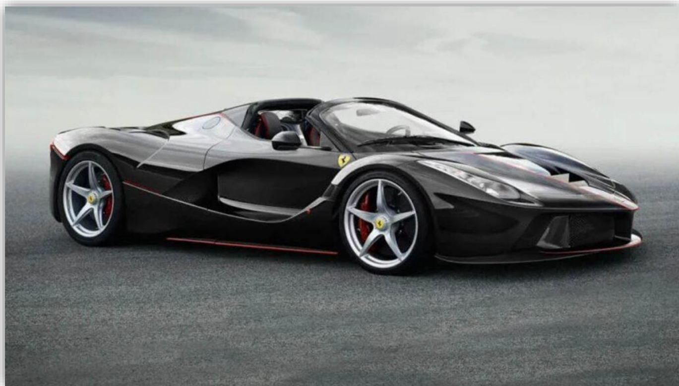
Ferrari LaFerrari Aperta.