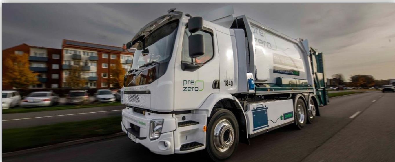
Volvo FE Electric har 300 kushar.