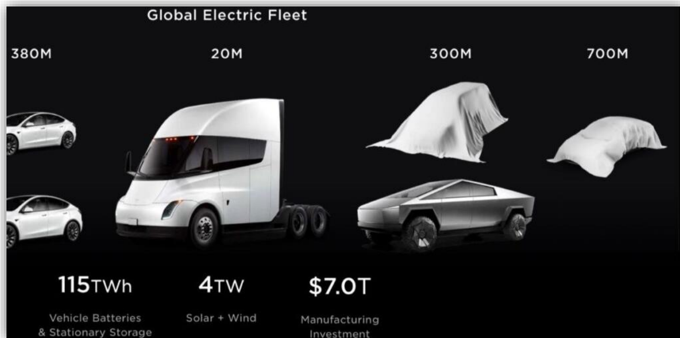
Bildskärm från Teslas presentation i mars 2024.

Tesla har berättat att man utvecklar en kompakt bil som ska göra det möjligt för ännu fler att skaffa elbil, detta genom ett lågt pris. Rykten säger att man försöker lägga sig runt 20 000 USD men om man når dit eller ej är oklart i nuläget. Det är också oklart vilken storlek bilen kommer ha men mest troligt är en elbil på runt 4,2 m. Om Model 2 blir det riktiga namnet är också oklart.