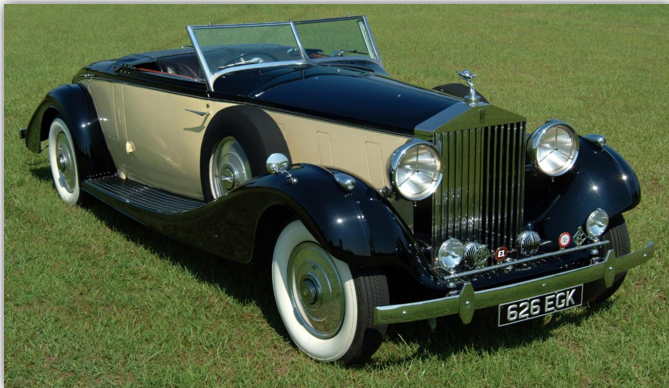
Rolls-Royce Phantom III Henley Roadster 1937

Phantom höll måttet och mer därtill. Det blev en modern, vågad, extravagant ändå klassiskt återhållen och samtida tolkning av den enda verkliga lyxbilen på jorden. Den hade i princip bara en överman visade det sig - och det stod också att läsa i Klassikers uttömmande test i nummer 8/2006: Cykelbilen Fantom. Fantom sopade banan med Phantom i rond efter rond.