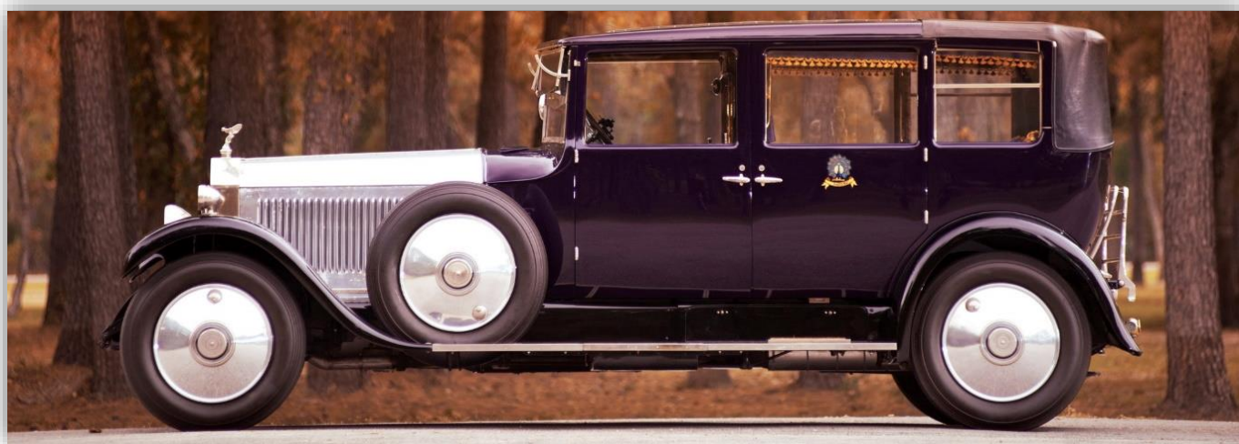
Rolls-Royce Phantom I Enclosed Drive Landaulette by Mulliner 1927.

I januari 2003 (re)lanserades modellnamnet Phantom. Den klassiska beteckningen valdes för att markera återkomsten av bilvärldens kanske starkaste varumärke - Rolls-Royce. Förväntningarna var skyhöga och spekulationerna kring hur BMW skulle hantera denna Storbritanniens kronjuvel var både vilda och lite ängsliga.