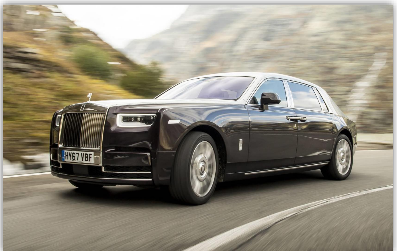
2018 Rolls-Royce Phantom EWB

Phantom V är (åtminstone för den ovane) till förväxlingen lik Silver Cloud. Den fanns mellan 1959 och 1968 och efterträddes av Phantom VI som fanns till 1991! Båda dessa generationer hade den klassiska V8:an på 6,2 alternativt 6,7 liter.