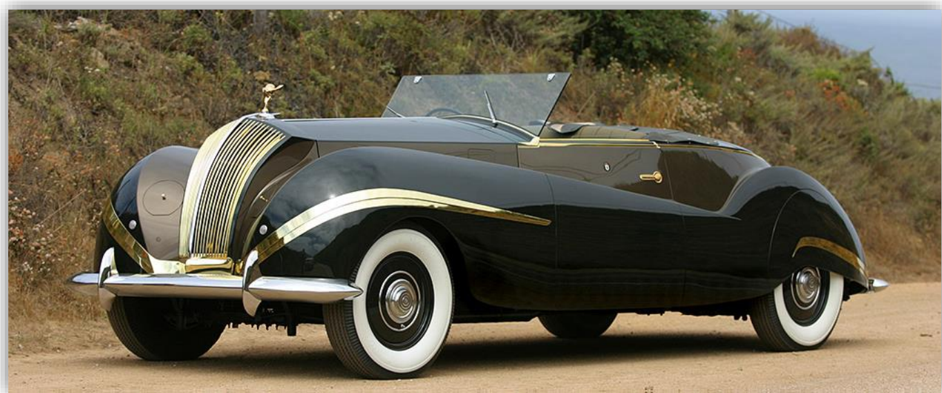
Rolls-Royce Phantom III Labourdette Vutotal Cabriolet 1947

Modellnamnet Phantom användes första gången 1925 på den modell som efterträdde av urbilen Silver Ghost. Phantom tillverkades både i USA och Storbritannien (med olika längd) och som brukligt vid den här tiden tillhandahöll fabriken ett komplett rullande chassi där kunden själv var fri att uppsöka en lämplig karossbyggare. Drygt 3 000 chassin byggdes av Phantom I, det sista 1931.