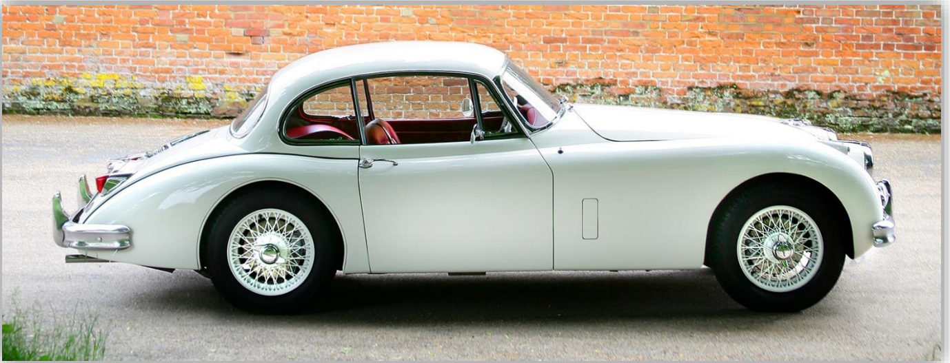
Jaguar XK150 Fixed Head Coupe 1958–61