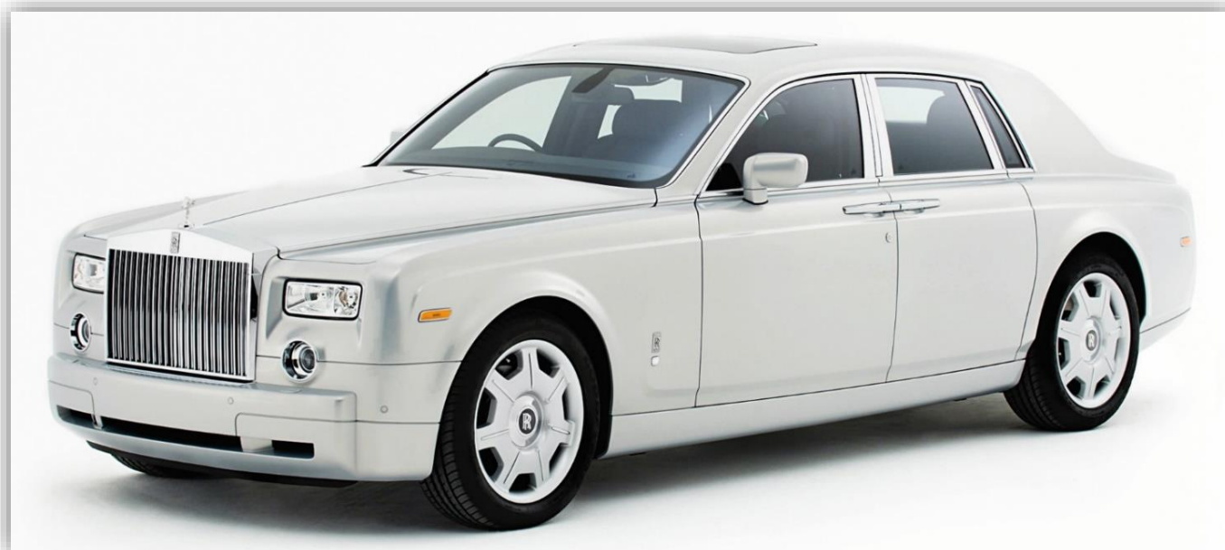
Rolls-Royce Phantom Silver Edition 2007

Enligt alla logikens lagar följde sedan Phantom II och vidare till Phantom VI. Men logik är inte alltid glasklar, till exempel byggdes Phantom I och Phantom II under en kortare period parallellt. Men några nerslag: Phantom II hade i likhet med sin företrädare en rak sexcylindrig motor på maffiga 7,7 liter! Fanns fram till 1936. Något mindre till volymen (7,3 liter) var motorn till Phantom III, men cylindrarna var desto fler - V12. Den sista förkrigs-Rolls.