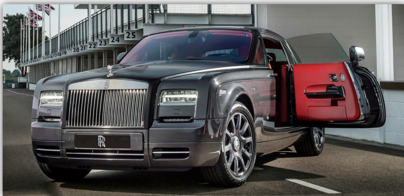
Rolls-Royce Phantom Coupé Chicane 2013.

Den allra första Phantom IV (och därmed hela serien) tillkom på initiativ av dåvarande prinsessan Elisabeth och hennes make Hertigen av Edinburgh. Den andra tillverkade Phantom IV konverterades till pick-up och användes för teständamål på fabriken!