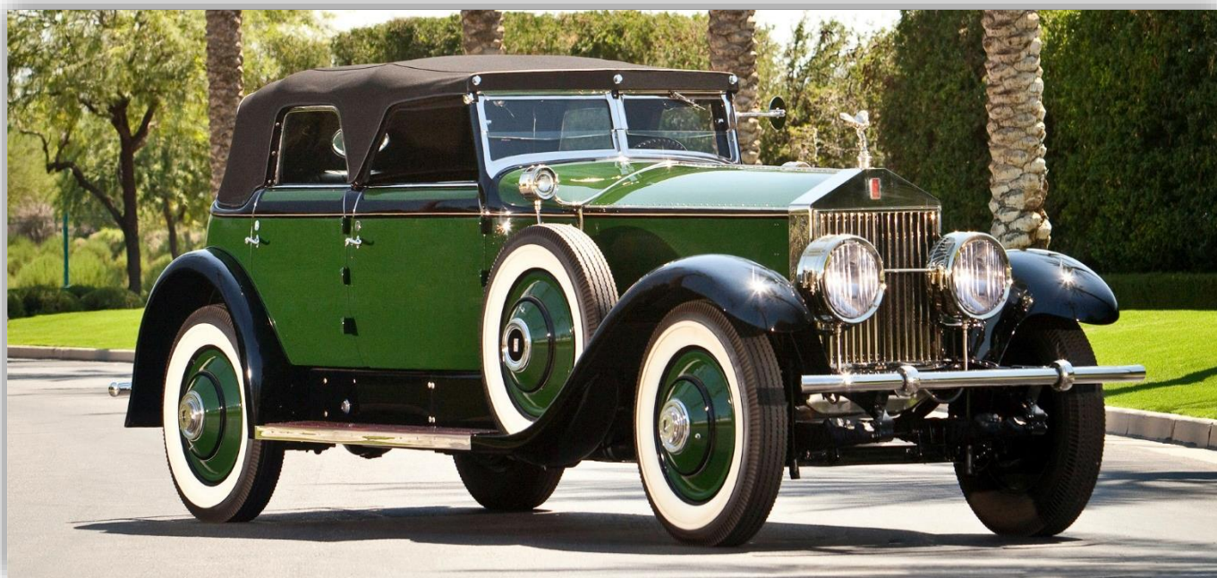
Rolls-Royce Springfield Phantom I Convertible Sedan by Hibbard & Darrin 1929.

Just denna dag när Inger och Ingrid har namnsdag firar Klassiker Rolls-Royce Phantom. Grattis säger vi!